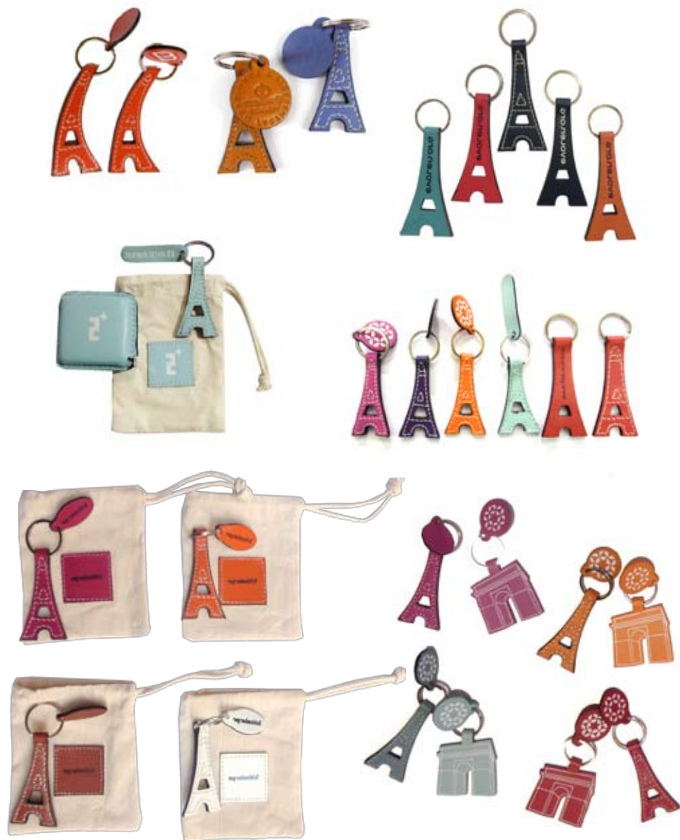
Sacs en coton et cuir marqué à chaud

Exemples de marquages à chaud, en creux ou en couleur